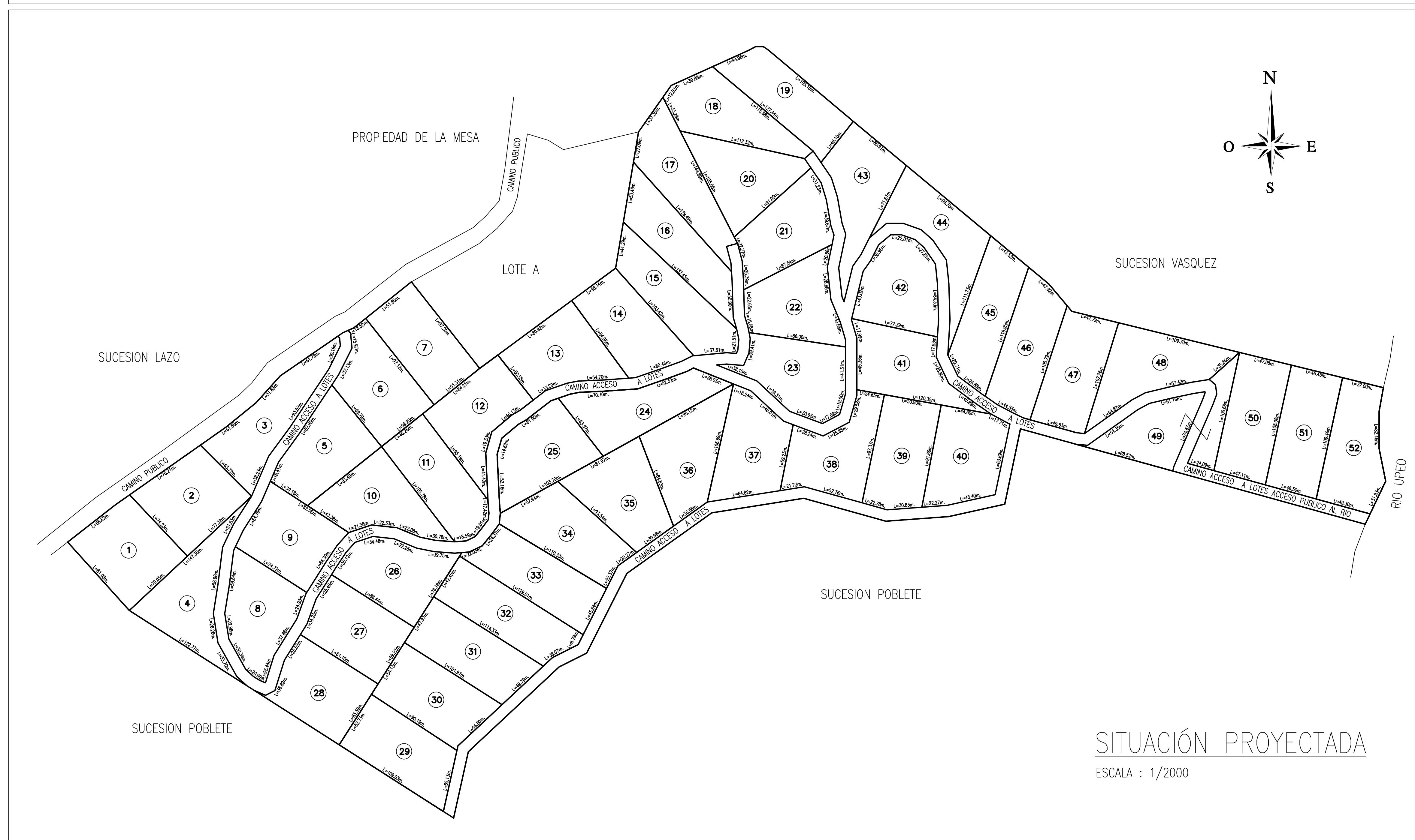
SITUACIÓN PROYECTADA ESCALA : 1/2000